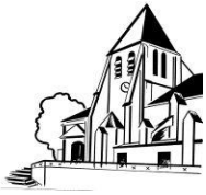
Saint-Germain de Charonne

Paroisse Saint Germain de Charonne 4 Place Saint Blaise, 75020 PARIS Tel : 01 43 71 42 04 Fax : 01 43 71 59 55 Mail : par.st.g.ch@wanadoo.fr Site : http:// :www.saintgermaindecharonne.fr/