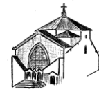
Saints-Cyrille et Méthode

Paroisse Saint Germain de Charonne 4 Place Saint Blaise, 75020 PARIS Tel : 01 43 71 42 04 Fax : 01 43 71 59 55 Mail : par.st.g.ch@wanadoo.fr Site : http:// :www.saintgermaindecharonne.fr/